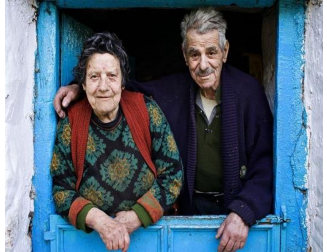
Icaria: il fascino sfuggente della longevità