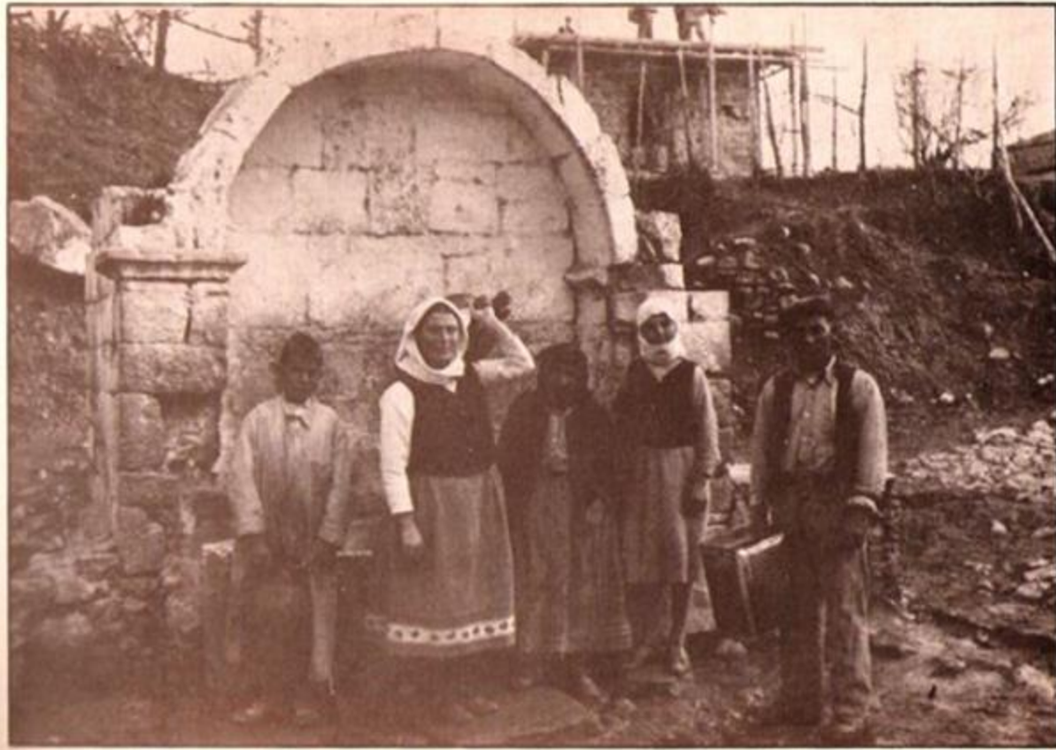
1936: Trasporto dell'acqua dalla fontana della piazza di Kapandriti, in Attica, Grecia